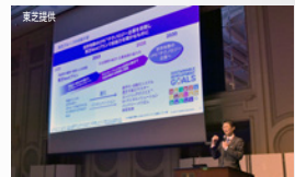
「TOSHIBA OPEN INNOVATION FAIR 2019」にて

CPS(Cyber Physical System)とは実世界(フィジカル)の凡ゆるデータをデジタル技術で解析・分析・理解(サイバー世界)し、実世界にフィードバックすることで新たな世界を創造する仕組みをいう。「CPSで一番重要なのはデジタルビジネスモデル」という。製造現場で培ってきた知識・経験・技術と産業界でのデジタル・トランスフォーメーションをはじめとしたIoT・AI分野での強みを融合。ビジネスに新たな付加価値を生み出して社会の更なる発展に貢献しようとしている。その中核が氏。