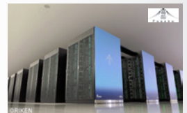
スーパーコンピュータ「富岳」

2014年、「京」の後継機として理化学研究所・富士通の共同開発で始まったスーパーコンピュータ「富岳」は、「ISC 2020年度スーパーコンピュータ世界ランキング」、「コンピュータ演算速度」、「AI処理能力」、「ビッグデータ分析性能」の4部門で何れも2位に大差をつけて世界1位を獲得。神戸市ポートアイランドの理化学研究所 計算科学研究センターに設置。日本の技術力と可能性を示した。4部門同時に1位を獲得したのは「富岳」が最初。今、理研で「富岳」による新型コロナウイルス対策への研究開発が始まった。