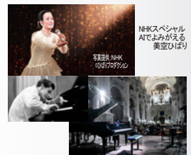
グレン・グールドの音楽表現にAIで追ったコンサート